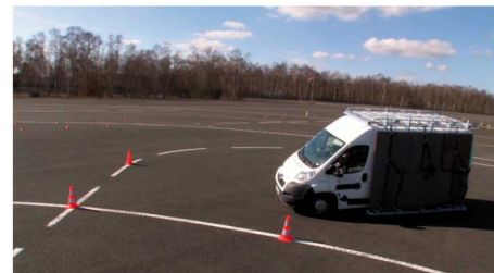
Simulations de ronds-points

La sécurité et la qualité de nos produits sont des critères essentiels. Chaque accessoire que nous concevons et distribuons, fait l'objet d'essais rigoureux, réalisés en interne ou par des organismes certifiés.