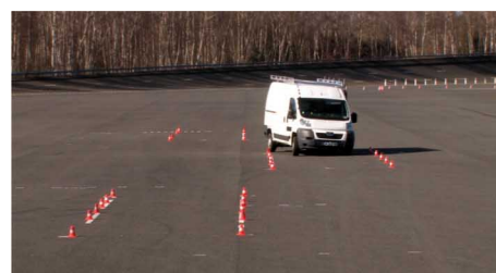
Simulations d'évitements et de freinages