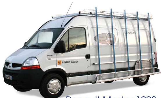
Renault Master 1998