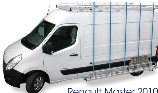
Renault Master 2010